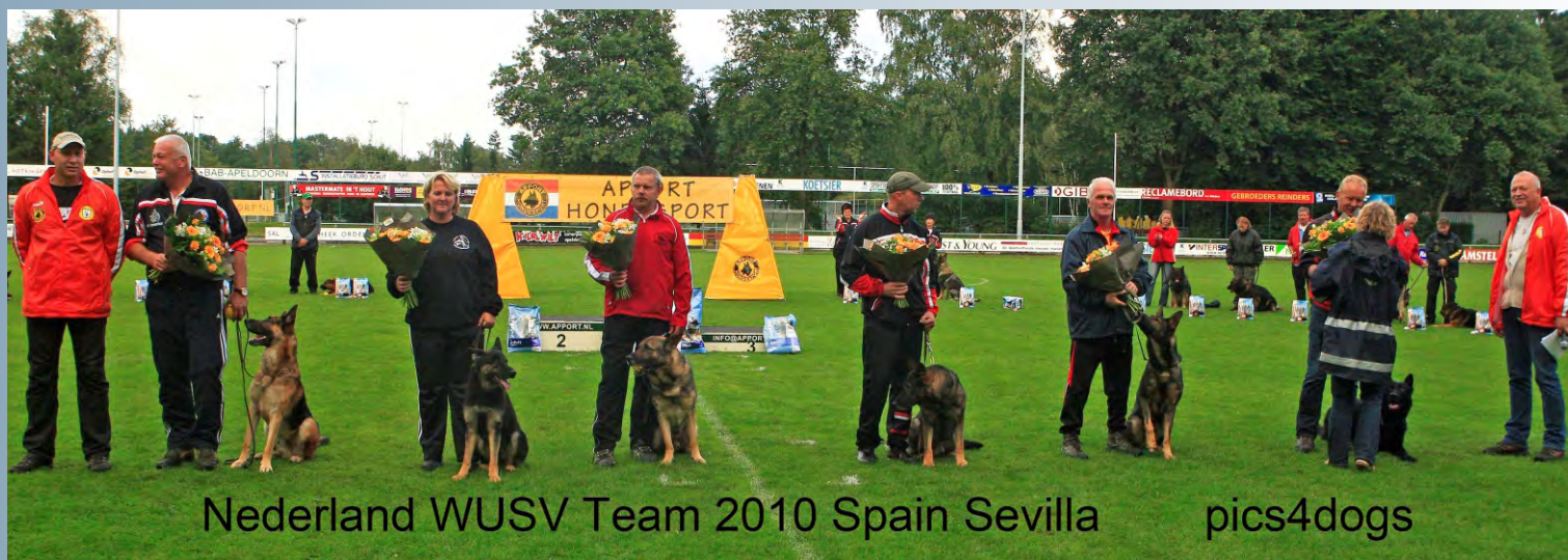
Nederland WUSV Team 2010 Spain Sevilla