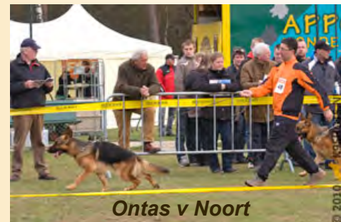
Ontas v Noort