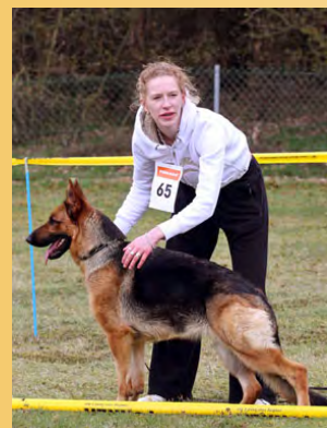
Lesly von Dan Alhedys Hoeve