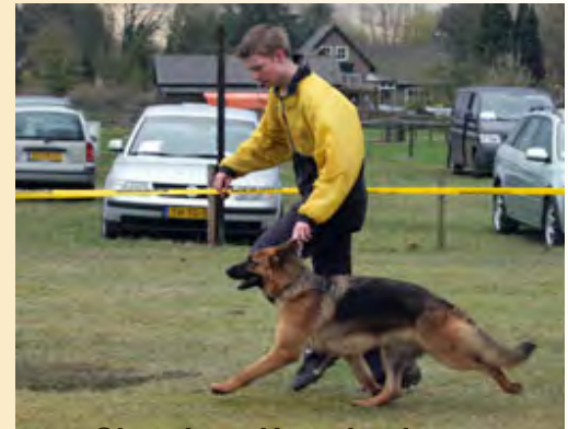
Chandra v Haus Lacherom