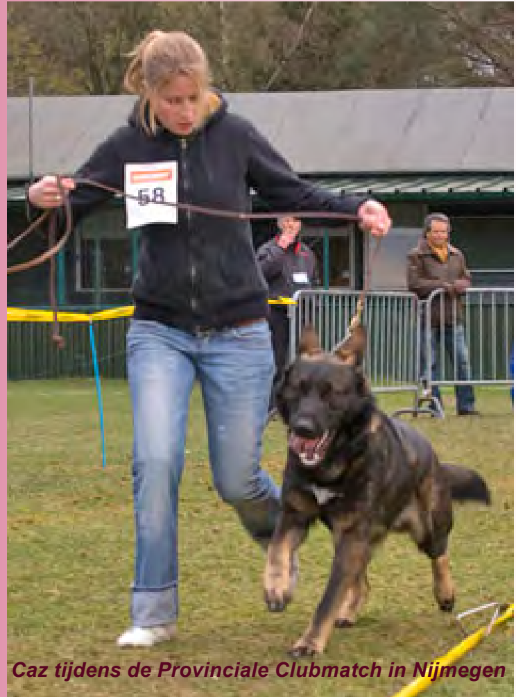
Caz tijdens de Provinciale Clubmatch in Nijmegen