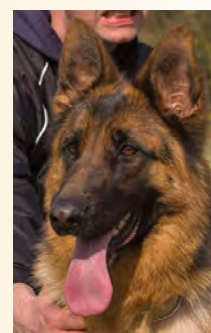
Woopy Bonita vd Ybajo Hoeve