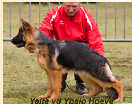
Yalta vd Ybajo Hoeve