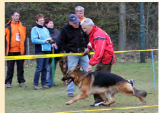
GaUCHO vom Esterlager