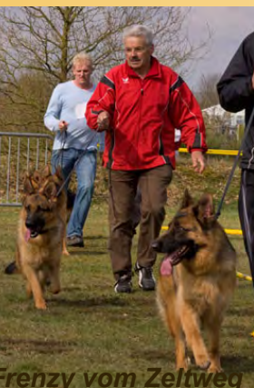
Frenzy vom Zeltweg