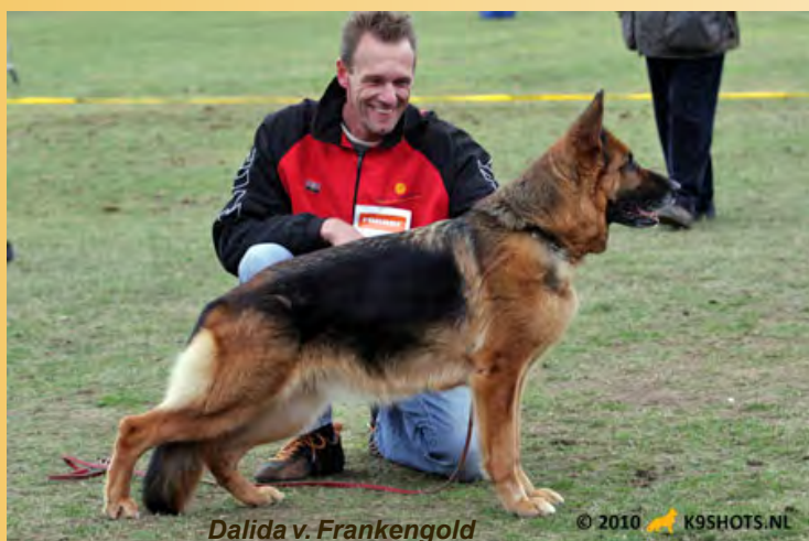
Dalida v. Frankengold